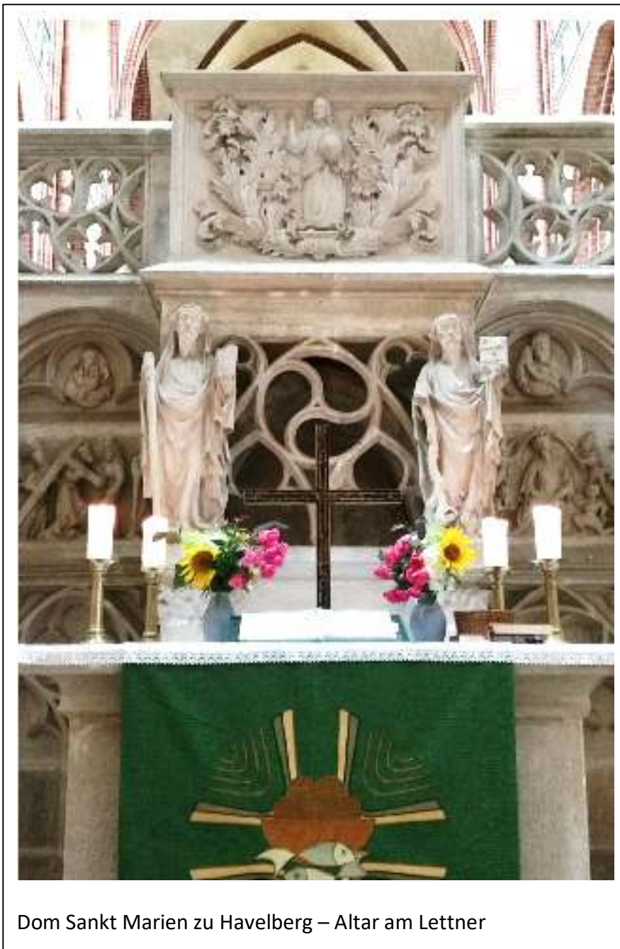
Dom Sankt Marien zu Havelberg – Altar am Lettner

Religionen sind die Geißel der Menschheit. Anonym