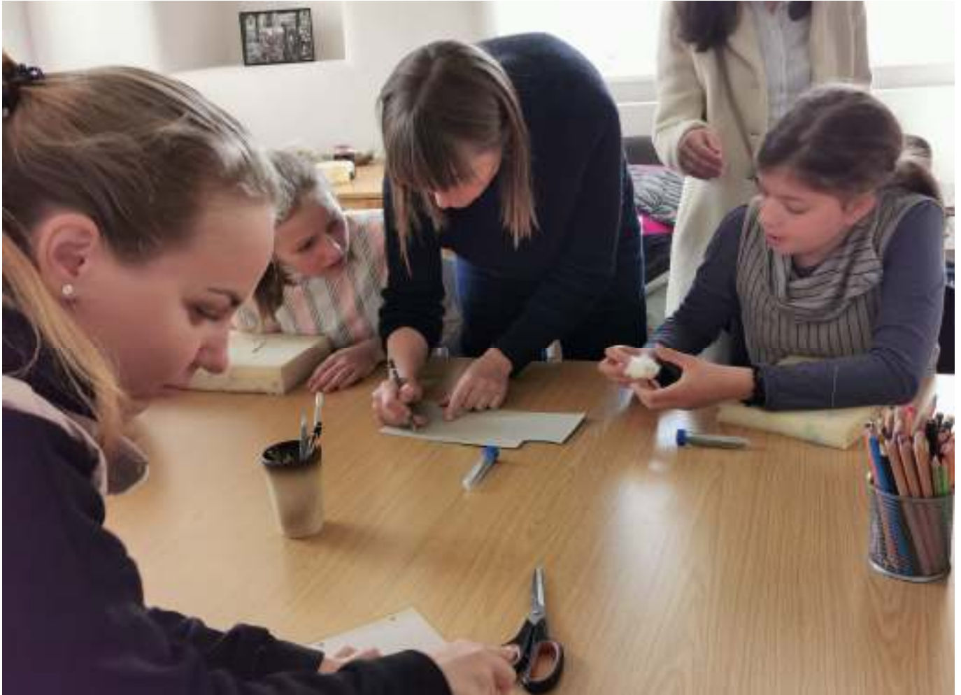
Kindergottesdienst: Es gibt Geschichten rund um die Bibel und immer etwas Spannendes am Basteltisch. Dafür sorgt das Kindergottesdienst-Team.