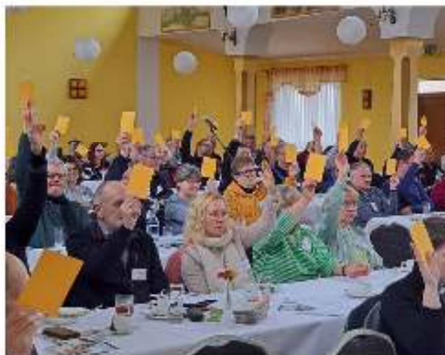
Abstimmung der Synodalen in Wusterhausen

Ein wichtiger Tagesordnungspunkt war die Vorstellung und Abstimmung über die neue Synodensatzung, die die Zusammensetzung der Synode ab 2026 regeln wird. Der Anzahl von einer/-m Synodalen je Wahlbereich wird nun eine Bemessungsgrundlage von 600 Gemeindegliedern zu Grunde gelegt. Sind in einem Wahlbereich mehrere Pfarrpersonen tätig, wählt der Gemeindeglieder Rat eine Person als Mitglied, die nicht Gewählten sind Stellvertreter. Die Synodalen stimmten mehrheitlich für die Satzung, die nun dem Konsistorium zur Genehmigung vorgelegt wird. In finanziellen Angelegenheiten wurde der Jahresabschluss für das Jahr 2023 einstimmig angenommen.